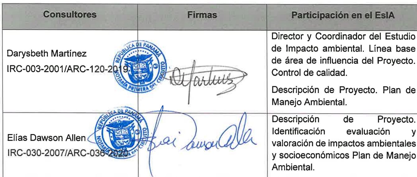
Cuadro 20: Firma de consultores

A continuación, se presentan las firmas debidamente notariadas de los consultores líderes que participaron en la elaboración del EsIA.