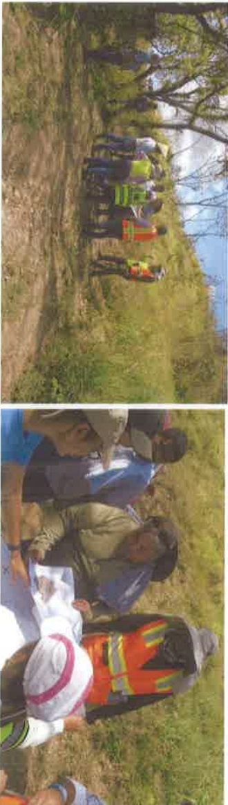
Unidades Ambientales Sectoriales durante la inspección.