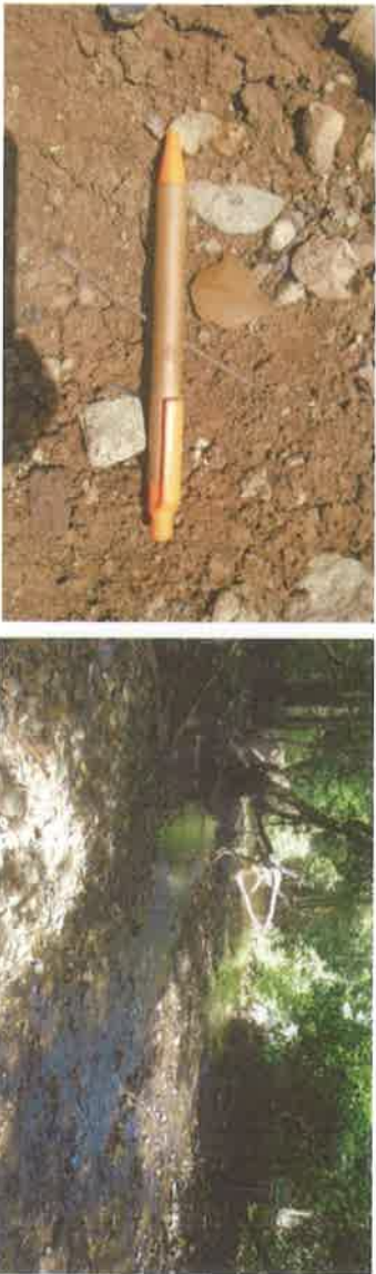
En las coordenadas UTM (Datum WGS84) 17P 0661696/1001918, se registró un fragmento de lítica cultural.