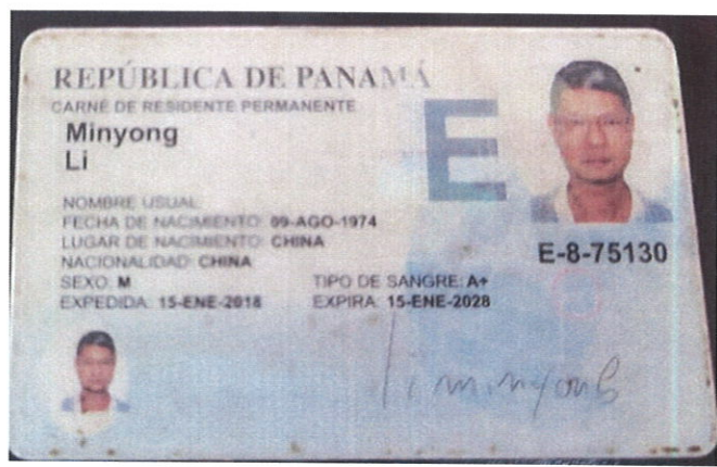
CEDULA DEL PROPIETARIO