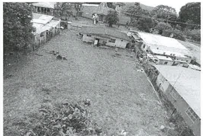
Foto No. 2. Vista panorámica de la propiedad.