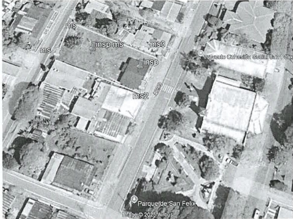
Figura N°1. Ubicación del proyecto con intención a desarrollar, coordenadas tomadas al momento de la inspección (iconos rojos).