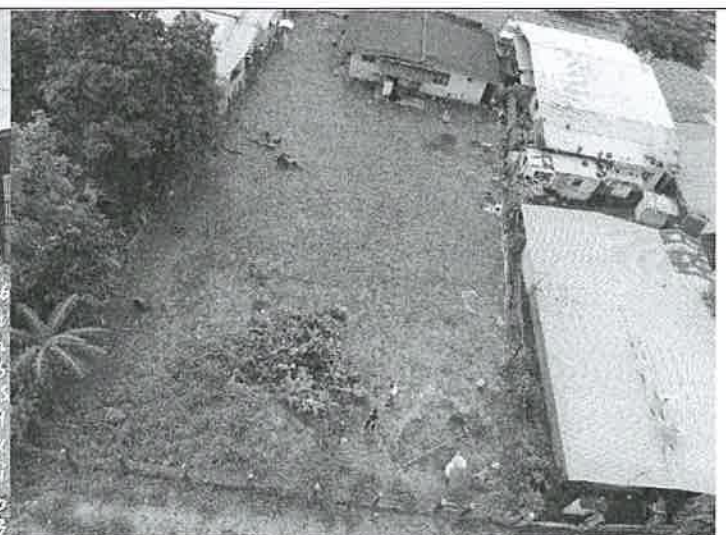
Foto No. 3 y 4. Vista de la entrada, áreas colindantes y Vista panorámica de la propiedad, topografía, vegetación.