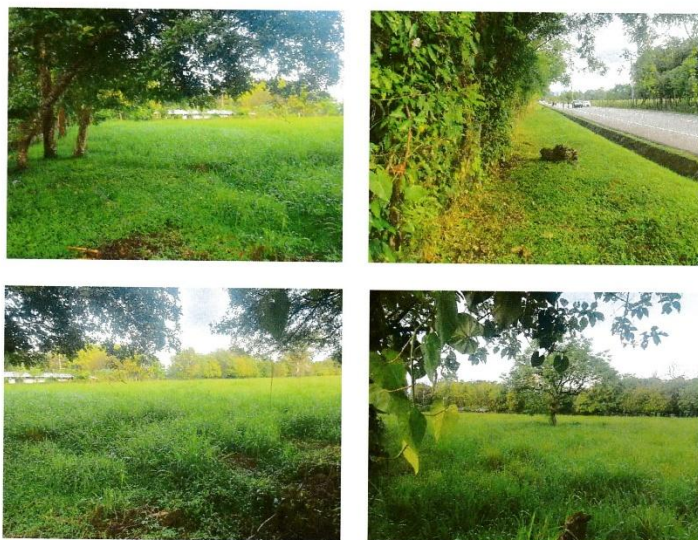
Fotos N° 1, 2, 3 y 4: Vista general. Tramo prospectado. Terreno plano tipo potrero alterado. Colindante con carretera con cuneta, sin servidumbre. Vegetación entre herbazales, gramíneas, rastrojo y algunos arbustos.

Durante el recorrido de los 2,948 m 2 de superficie del proyecto se observó que es un terreno plano tipo potrero, colindante con carretera sin servidumbre y con cuneta. La vegetación prevaleciente se compone de gramíneas, herbazales y rastrojo y algunos árboles. Se observaron estructuras modernas en propiedad colindante. Se focalizó mayor esfuerzo prospectivo en el área de Impacto Directo. Se realizaron las pruebas de los pozos de sondeo en áreas propicias. No hubo hallazgos culturales.