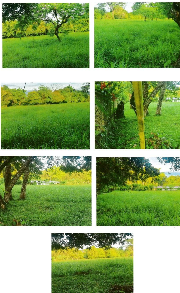
Fotos N° 13,14 15, 16, 17,18 y 19: Vista general. Tramo prospectado, Terreno plano tipo potrero. Con estructuras modernas en propiedad colindante. La vegetación predominante es gramíneas, herbazales y rastrojo con algunos árboles y arbustos.