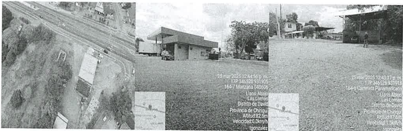
Foto 4. Vista panorámica del terreno y sus características actuales.