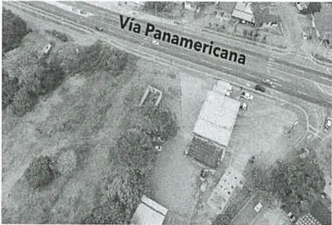
Foto 1. Vista aérea del área de acceso, a través de la vía Panamericana.