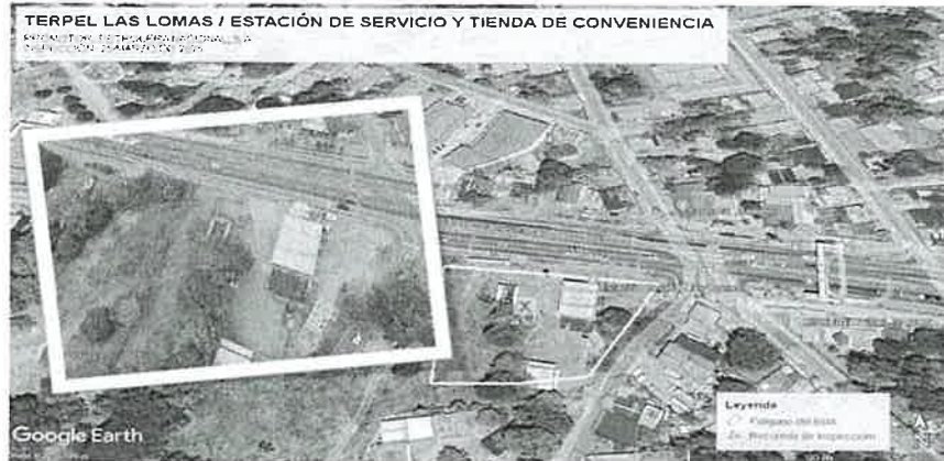
Figura N°1 Ubicación del proyecto con intención a desarrollar, recorrido realizado al momento de la inspección, el día 25 de marzo de 2025 (Puntos en color anaranjado).