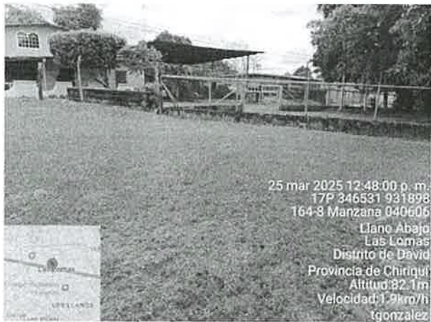
Foto 2. Vista de viviendas colindantes con el área del proyecto. Fuente: T. González. 2025