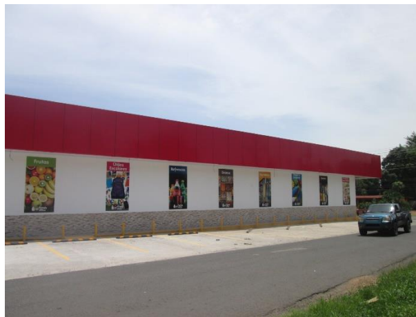
Vista lateral del proyecto. Se observa el depósito y el local remodelado.