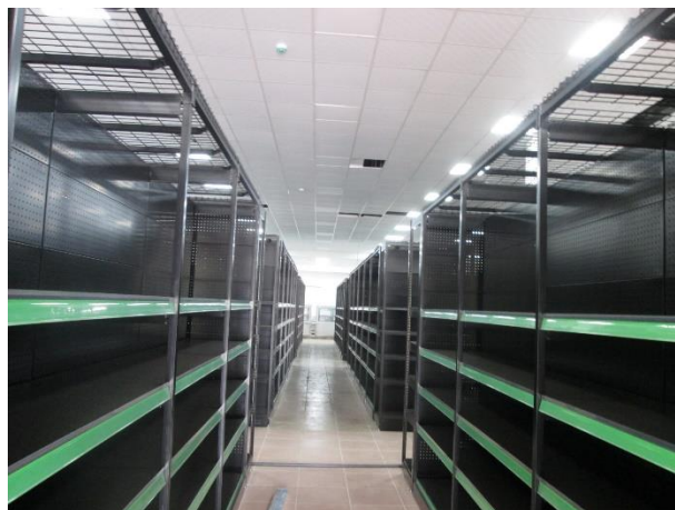
Vista del interior del proyecto y los anaqueles de mercancía instalados.