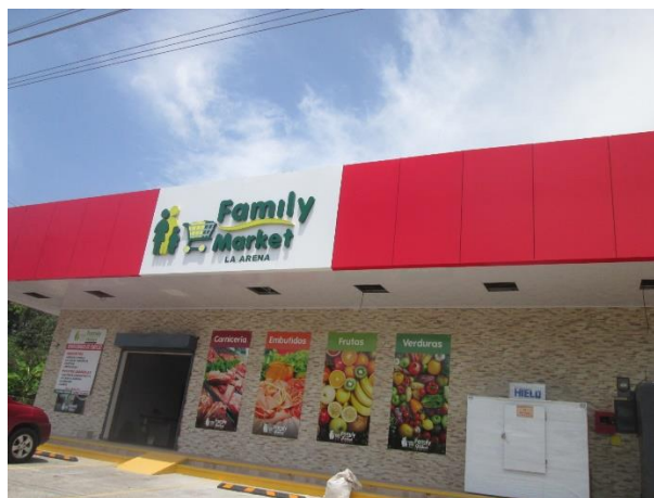
Vista frontal del proyecto