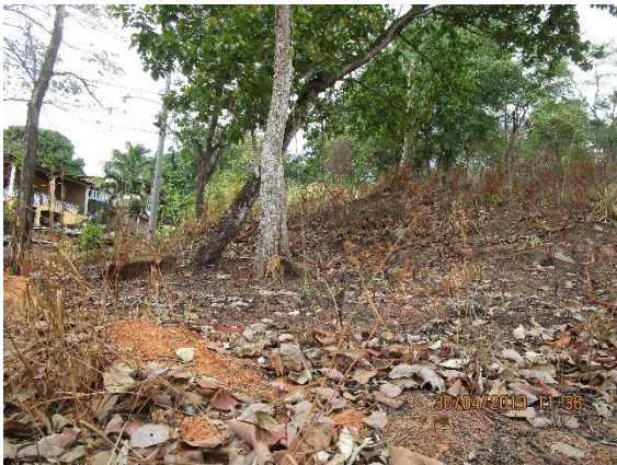
Fotos No. 15, 16, 17 Prospección en tramos alterados del polígono.

Dadas las condiciones pedregosas y de rellenos basura del sub-suelo, hubo pocos sondeos.