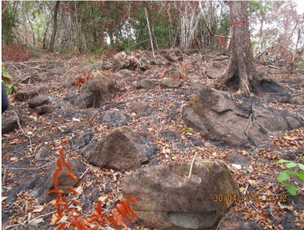
Fotos No. 12, 13, 14 Prospección en tramos alterados del polígono Observe herbazales quemados, y tramos con afloramientos pedregosos.