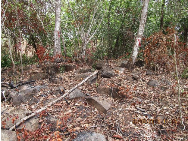
Fotos No. 3, 4, 5, 6, 7 Prospección en tramos Alterados del polígono.