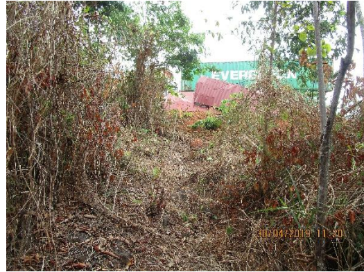
Fotos No. 8, 9, 10, 11 Prospección en tramos

Alterados del polígono. Observe herbazales quemados, y tramos con afloramientos pedregosos.