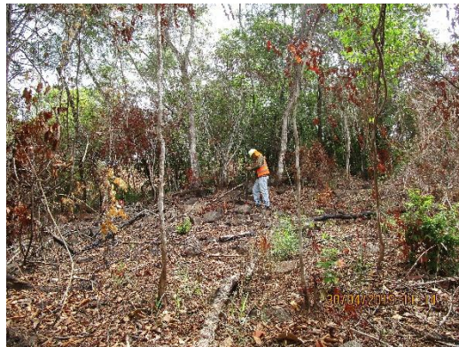
Fotos No. 1 y 2 Prospección en tramos Alterados del polígono