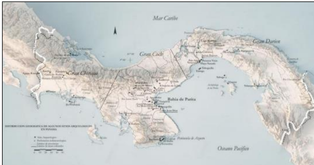
Ilustración 2: Mapa de zonas arqueológicas de Panamá

Fuente: Mapa arqueológico de Panamá. Localización de las áreas culturales de Gran Chiriquí, Gran Coclé y Gran Darién, Pág. 17.- Tesis Doctoral, Julia del Carmen Mayo Torné. La Industria prehispánica de conchas marinas en “Gran Coclé” Panamá.