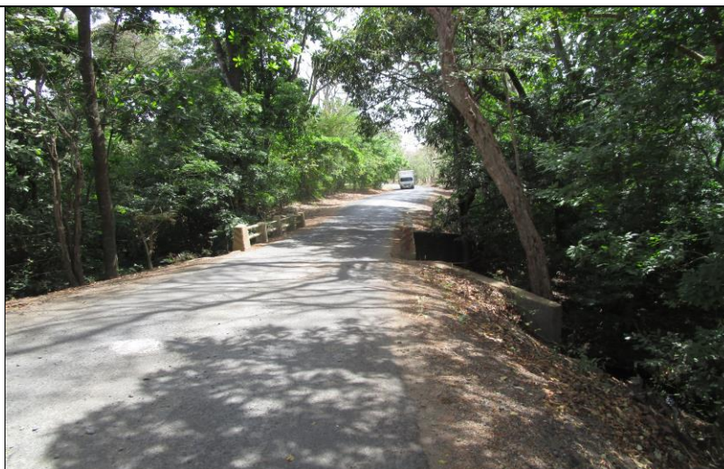
Fotografía 2 Prospección Arqueológica