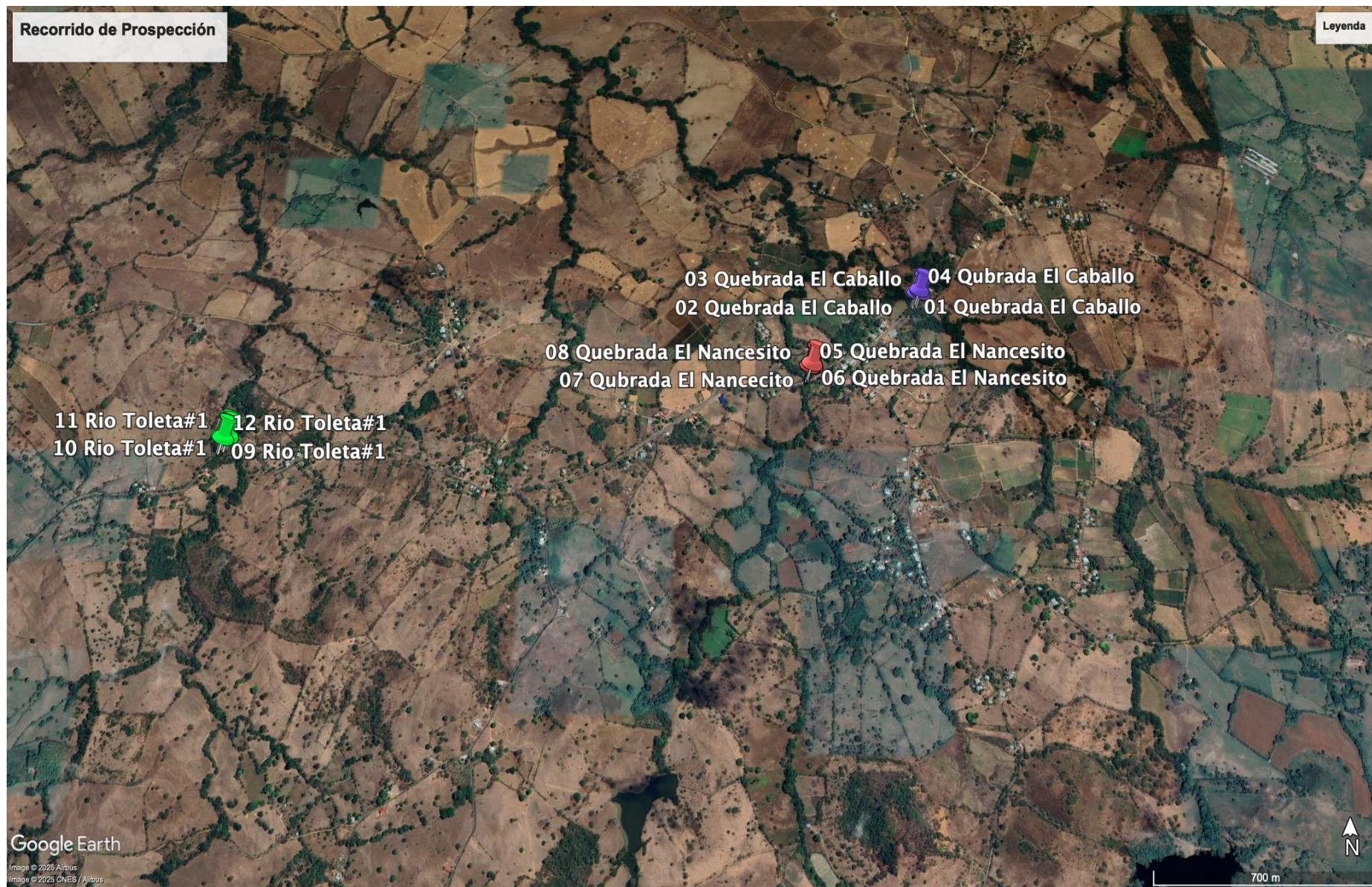
Mapa 1: Prospección