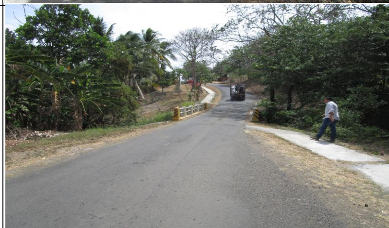
Fotografía 3 Prospección Arqueológica