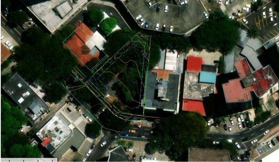
IMAGEN DE UBICACIÓN DEL PROYECTO