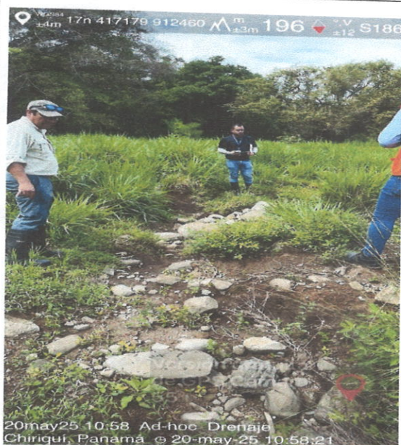
Vista parcial del recorrido original del drenaje.