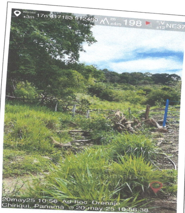
Inicio de la canalización sobre el drenaje.