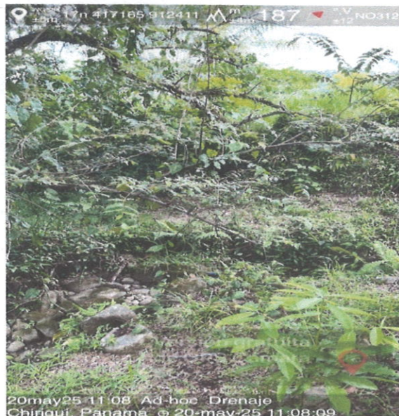
Fin de la canalización del drenaje.