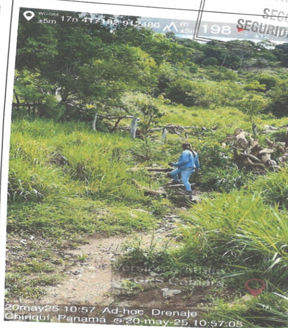
Vista de la entrada del drenaje a la propiedad.