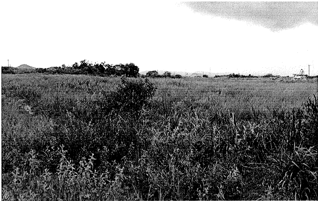
Fig. 1 y 2. Área propuesta para el proyecto.