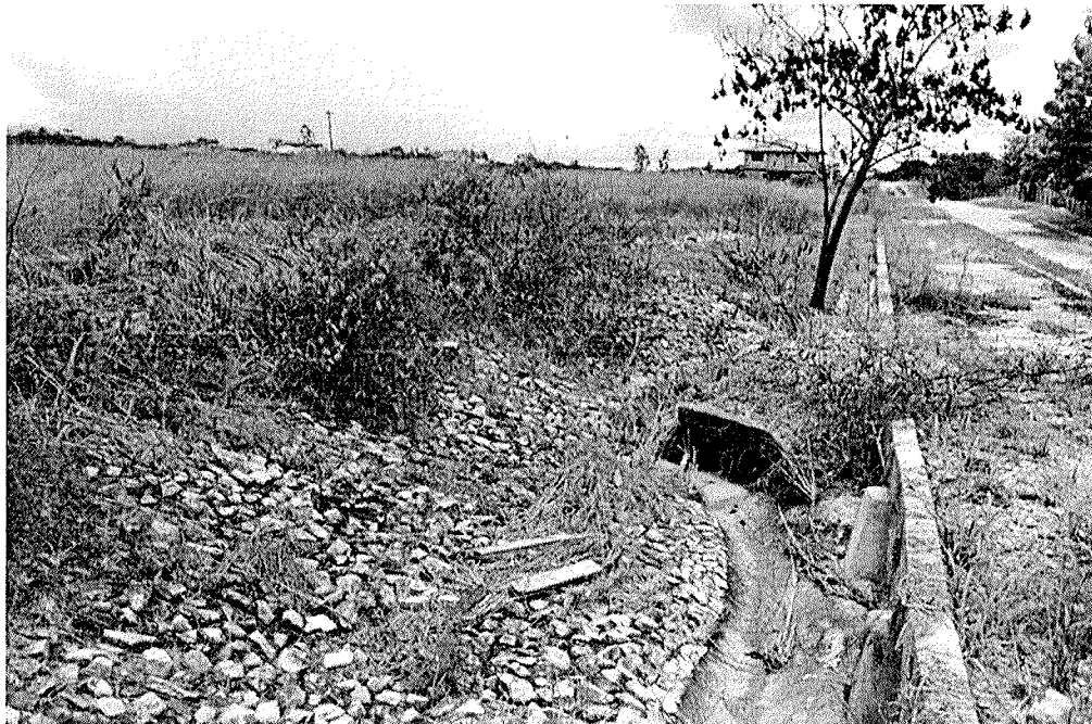
Fig. 3 Canales de aguas pluviales