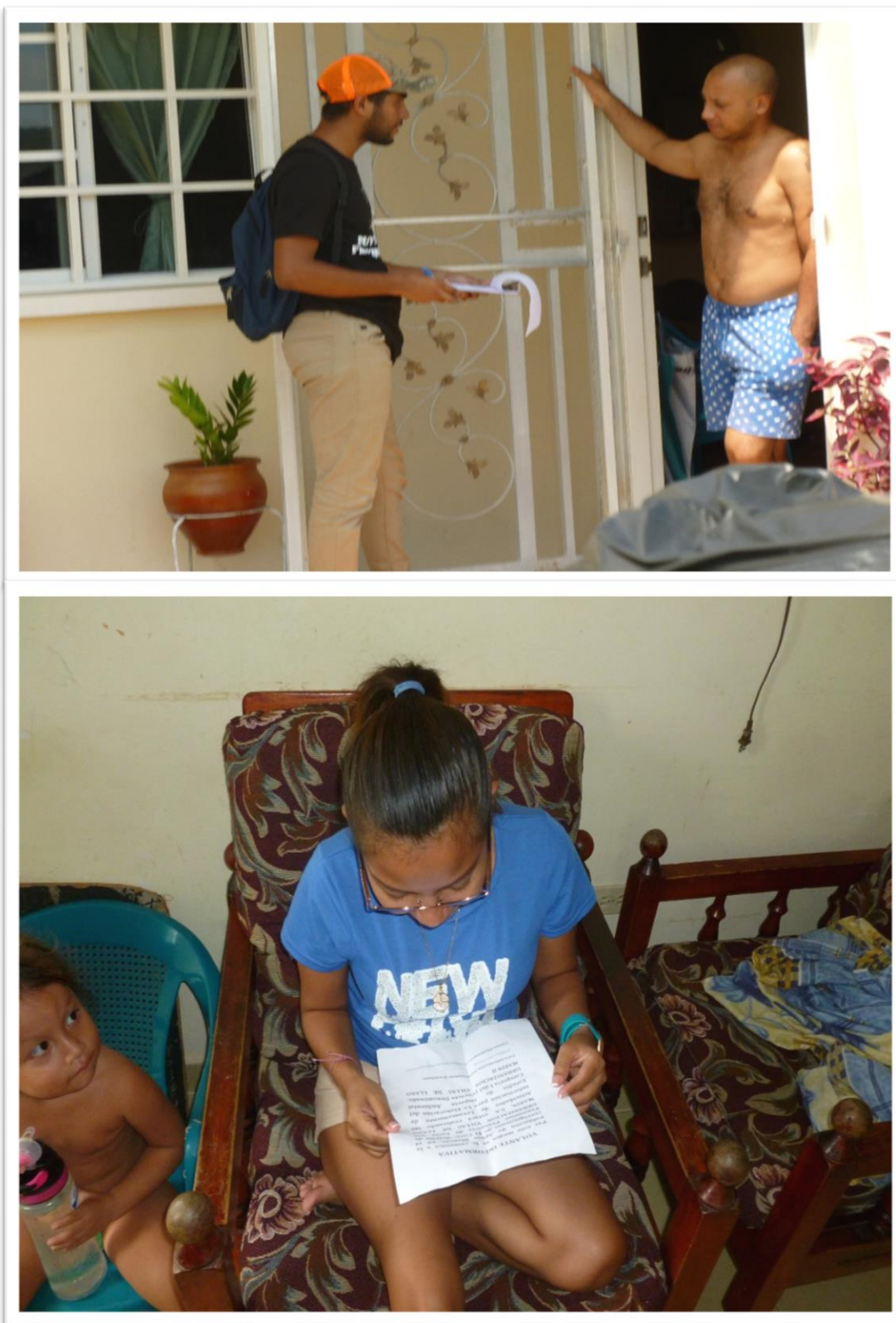
Participación ciudadana realizada a la comunidad mas cercana

ESIA CATEGORIA I / URBANIZACION VILLAS DE LLANO MARIN II