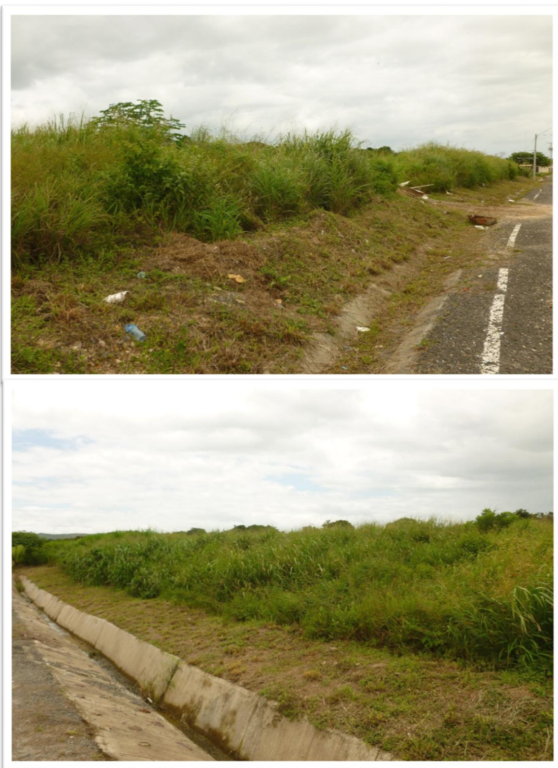
Vista del terreno donde se desarrollará el proyecto

ESIA CATEGORIA I / URBANIZACION VILLAS DE LLANO MARIN II