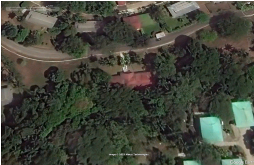
Polígono de proyecto en 2017