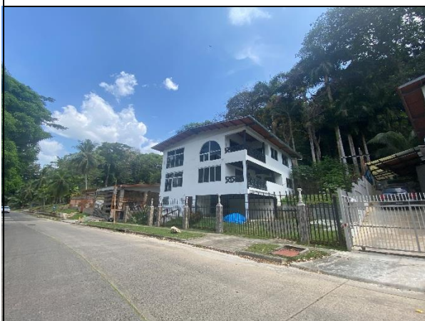
Viviendas colindantes al proyecto