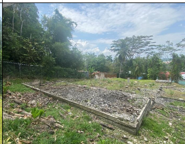
Restos estructurales de la antigua iglesia