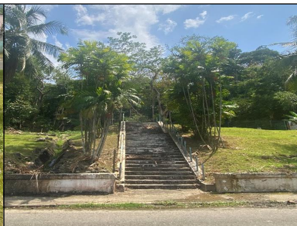
Escaleras de acceso al polígono