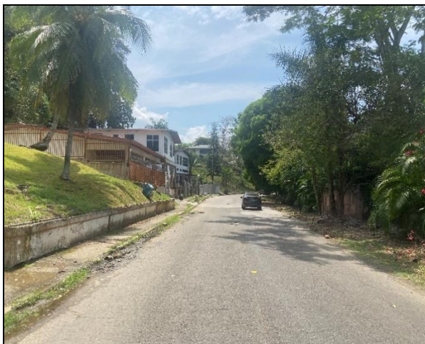
Vía de acceso – Calle Tomás Guardia