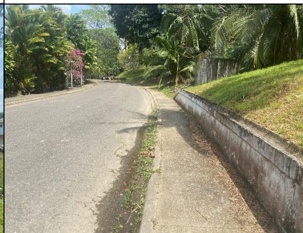
Acera peatonal y vía de acceso