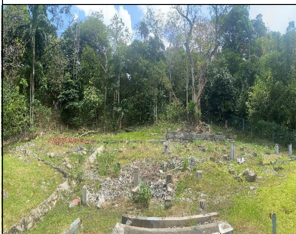
Vista general del polígono del proyecto