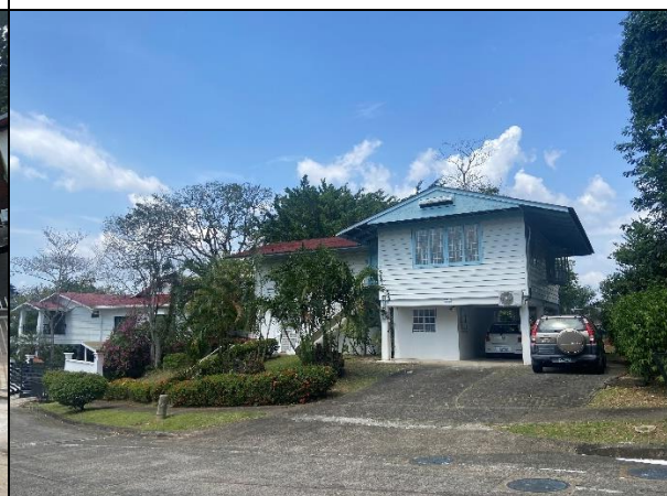
Viviendas colindantes al proyecto