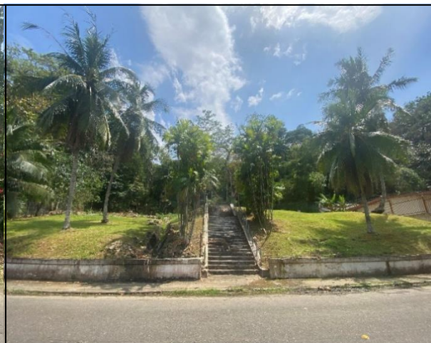
Vista frontal del polígono del proyecto