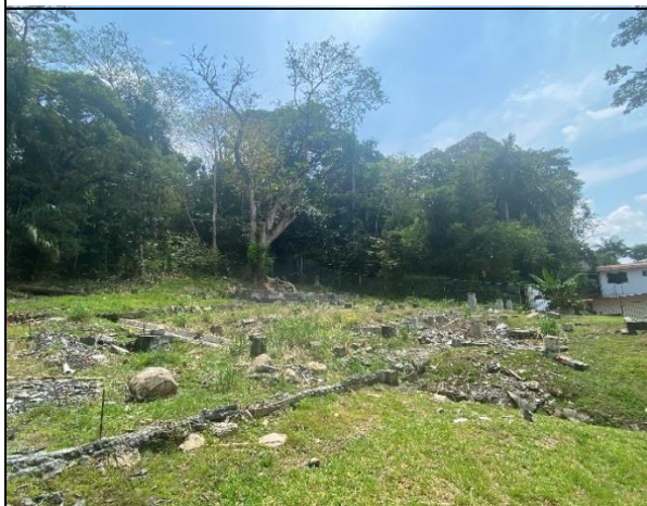
Restos estructurales de la antigua iglesia