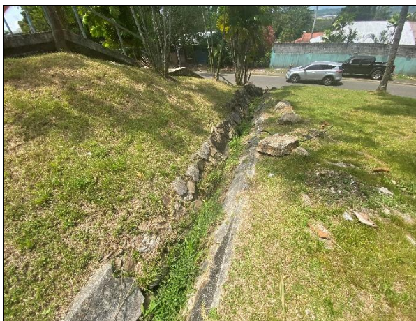
Sistema de drenaje de agua superficial