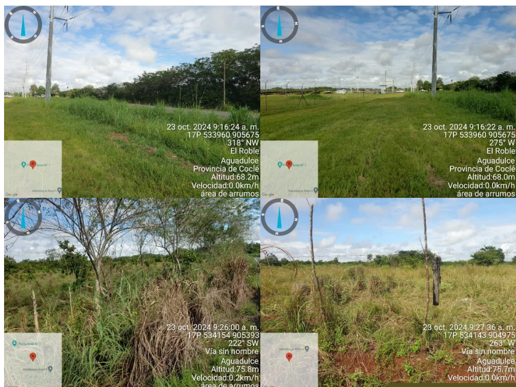
Fotos Nº 1, 2, 3, 4, 5, 6, 7, 8, 9, 10, 11, 12, 13, 14, 15, 16, 17, 18, 19 y 20: Vistas generales. Tramo prospectado. El terreno prospectado tiene una superficie mixta, mayormente cubierta de vegetación y áreas de tierra. Se observan árboles, matorrales, césped, postes eléctricos y aceras para el drenaje. Está delimitado por una cerca artificial y colinda con vías principales.

El siguiente cuadro muestra las coordenadas tomadas durante la prospección arqueológica: