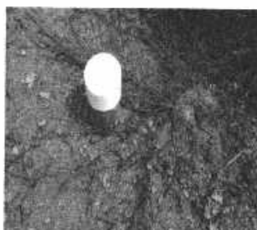
Foto No. 3: Pozo a utilizar por el proyecto Residencial Los Prados.