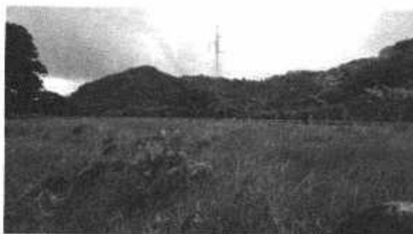
Foto No. 4: Línea de alta tensión eléctrica, colindante con el proyecto Residencial Los Prados