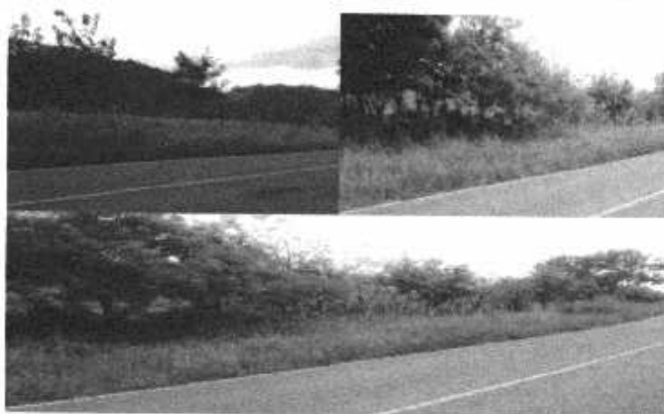
Foto No. 2: Vistas de la entrada del área donde se desarrollara el proyecto