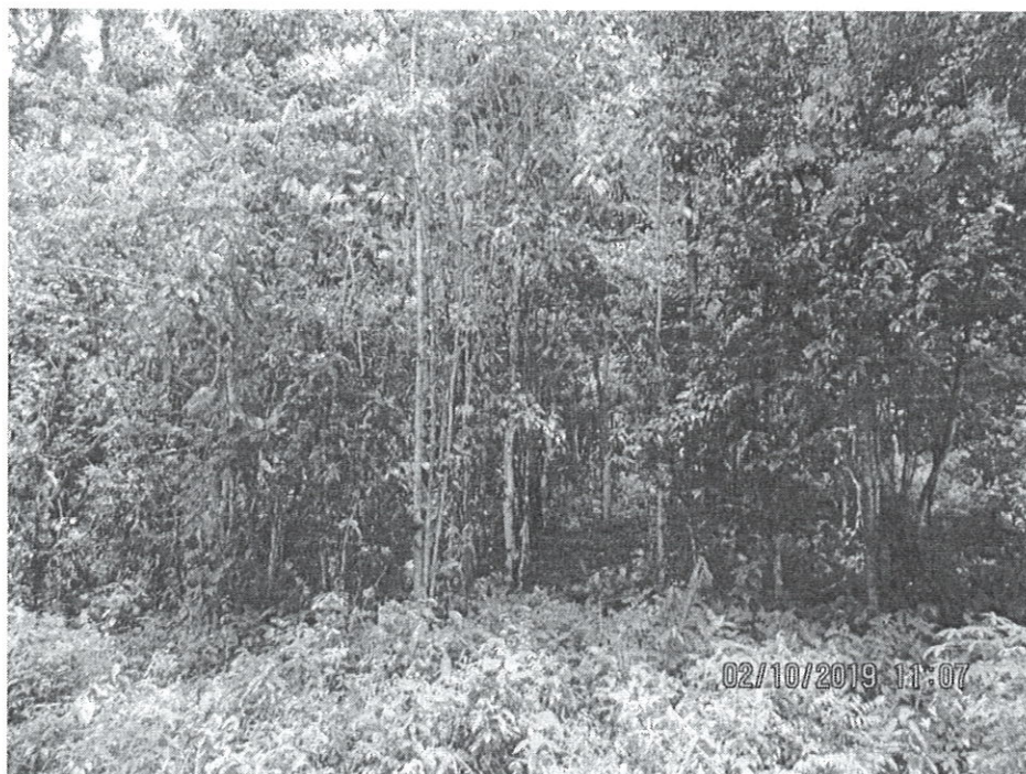
Foto N° 5. Vista del bosque secundario con desarrollo intermedio.

A handwritten signature in blue ink, appearing to be a stylized 'A' or similar character, located below the footer text.