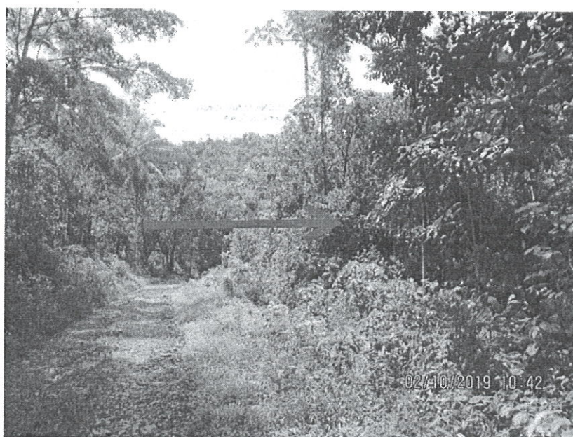
Foto N° 2. Vista de la carretera de piedra que va de Cascajal hacia Hacha, a un lado se observa el área boscosa que será afectada.