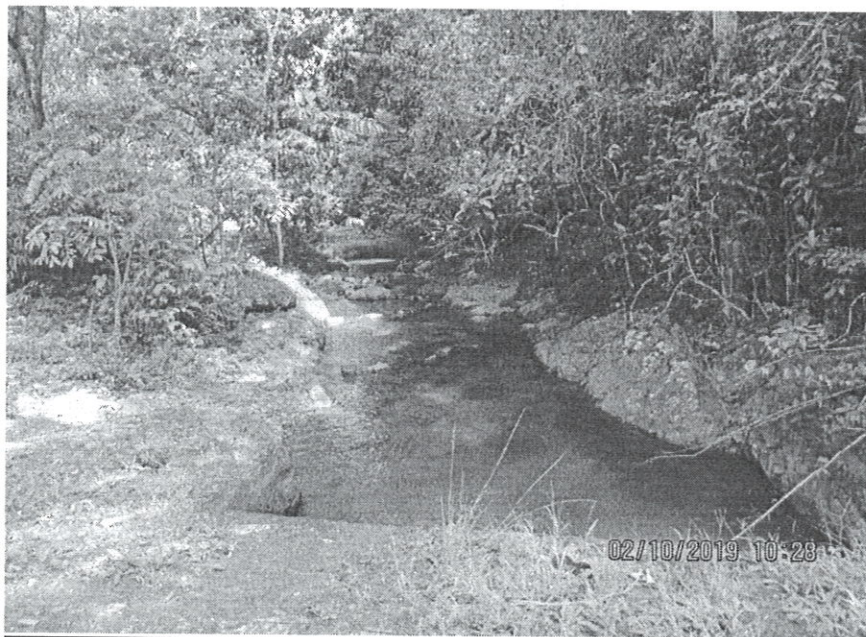
Foto N° 1. Vista de la quebrada El Tigrero, foto tomada en el paso del vado sobre la carretera hacia Hacha, (coordenada UTM WGS 84 559786 E – 966152 N). La quebrada La Tigrera nace en la parte alta de la sub cuenca del Río Cascajal, afluente importante que drena sus aguas al río Coclé del Norte cuenca N° 105. Actualmente esta quebrada no presenta perturbaciones, se observa aguas claras y cristalinas.